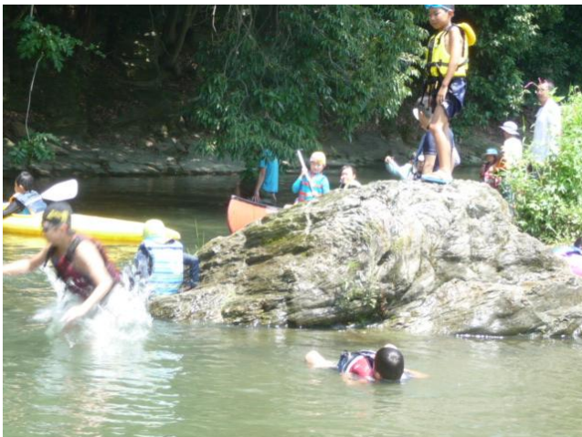
川あそび in 菖蒲園蛇行河川(ときがわ町8月4日)