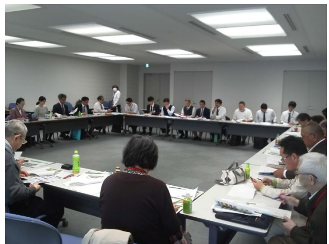
第4回河川協力団体意見交換会(関東地方整備局内) (3月26日)