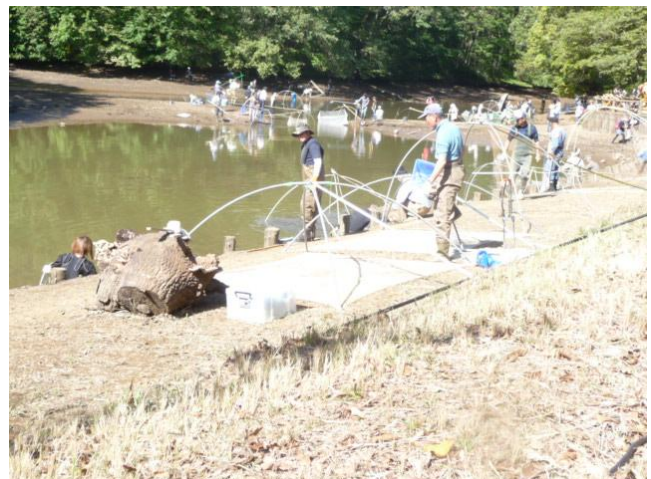
森林公園内あざみ沼にてウナギ捕り(10月21日)