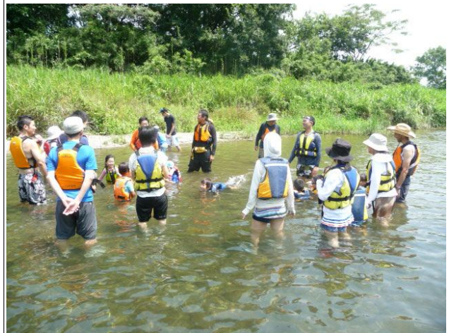
さいたま市の親子同伴「川あそび」(7月15日)