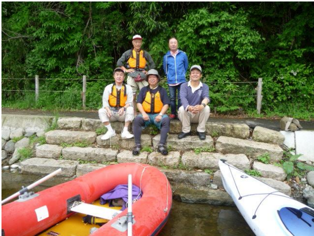
カヌー・ボートツーリングを終えて(6月12日)