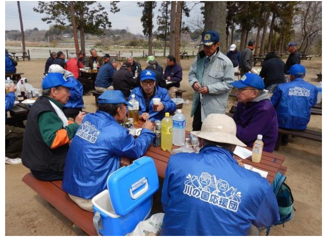
くらかけ清流の郷、BBQ 試食会 (3月26日)