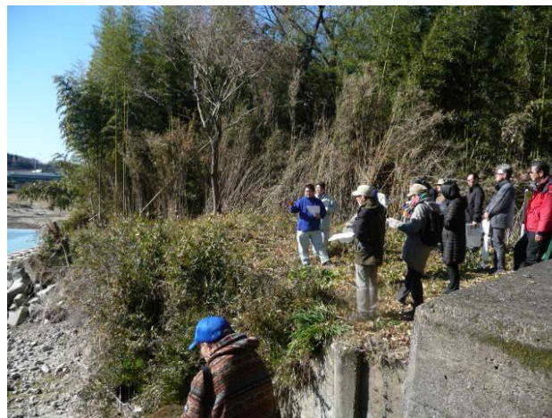
都幾川矢来堰（東松山市下青鳥）の、現状見学と魚道計画についての見学・意見交換会（同日）