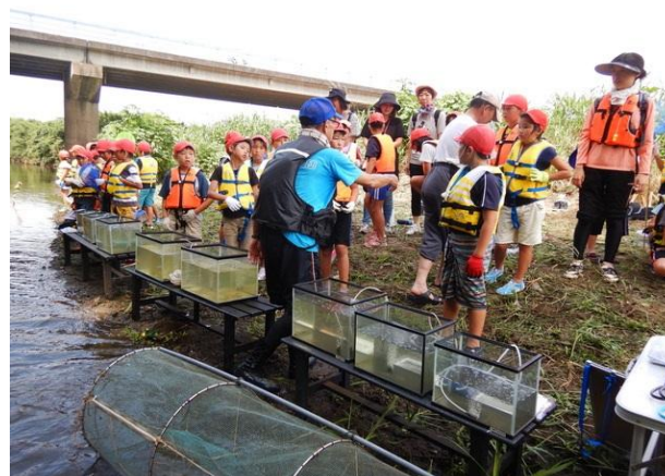
新宿小3年生 市野川探検・水辺観察(7月13日)