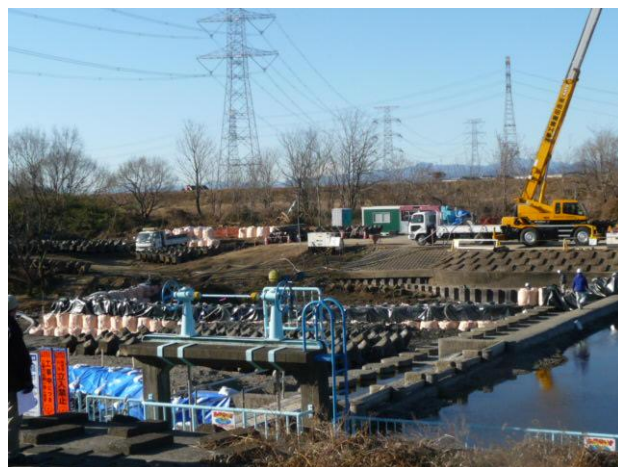
越辺川中山堰（川島町伊草）、右岸側の魚道工事現場を見学し県からの説明を聞く（H31年1月19日）