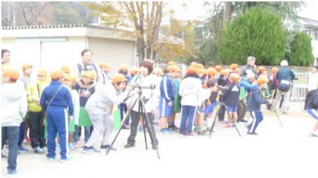
新宿小5年生バードウォッチング訓練(11月22日)