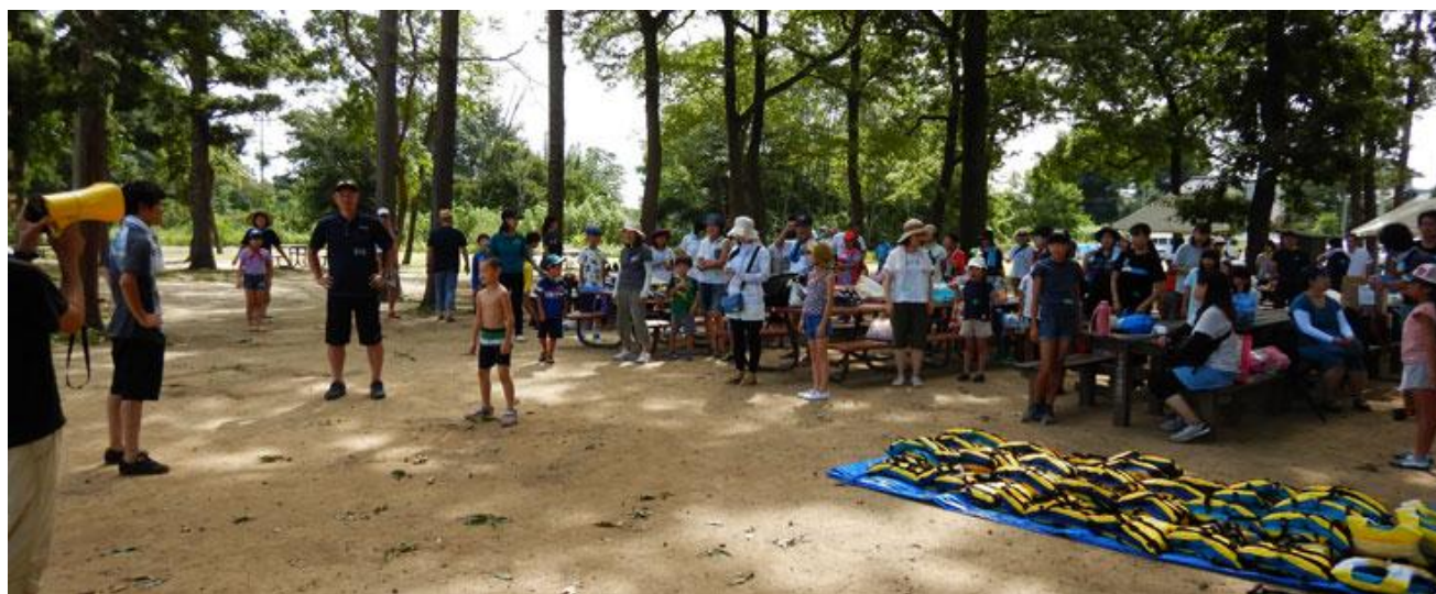
あつまれ!くらかけっこ! (くらかけ清流の郷に、市民親子80人が集合し開会式の挨拶)(8月23日)

※: 東松山市民活動推進事業費(助成金)を得ているので、 特別会計Ⅰ にて決算書類を取りまとめました。