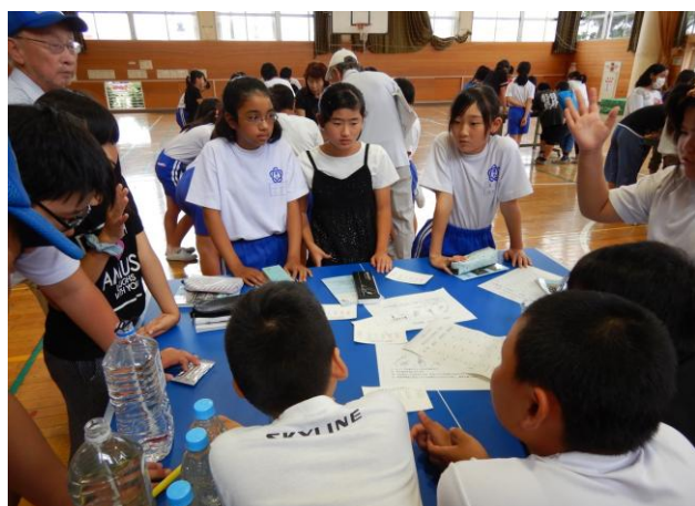
新宿小6年生 3河川の簡易水質調査(7月6日)