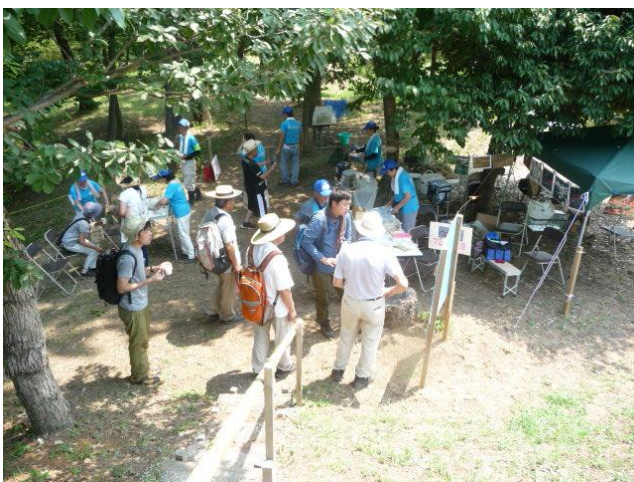
環境カレッジ「川ゼミ」の開講、滑川町羽尾地区 (8月5日)