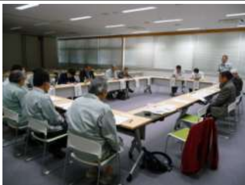
第1回川島町WT開催 会議風景