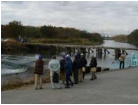
③越辺川の出丸堰（川島町）：現地見学と、河道・用水堰についての意見交換