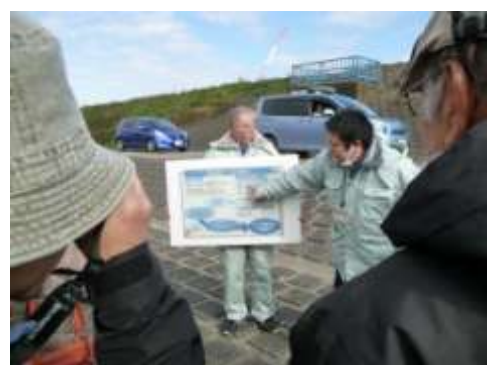
②越辺川の中山堰（川島町）：県・農林振興センターから、事業計画の説明