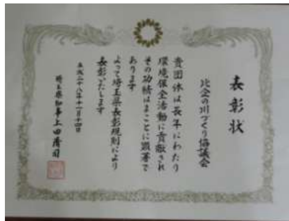
県知事による表彰状