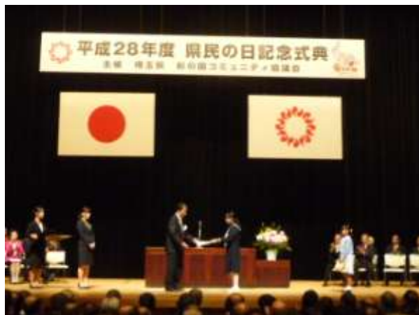
知事表彰の風景（さいたま市民文化センター）

表彰事績：「長年にわたり、都幾川、市野川流域の水環境保全活動に尽力してきた。この間、都幾川、市野川流域の住民に対する水環境保全意識を向上させるための普及啓発活動・水質調査・環境学習を行うなど、水辺環境の向上に貢献してきた。これらの功績は顕著である。」