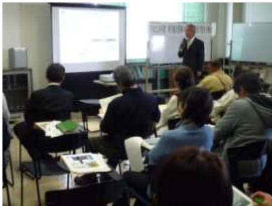
団体の活動事例発表会