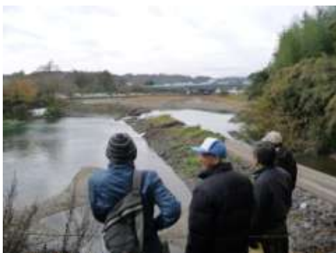
①都幾川の矢来堰（東松山市）：蛇カゴ主体の堰（中央部は、約5mが今年の台風で決壊）