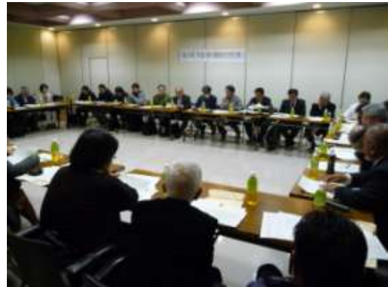
関東地方整備局・協力団体の意見交換会