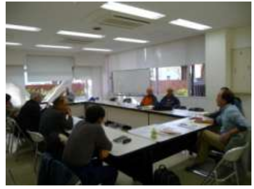
④東松山市民文化センターにて、住民・市民団体による希望・意見交換会