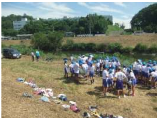
6年生の生き物調査(7月7日)

※：東松山市民活動推進事業費(助成金)を得ていますので、 特別会計 にて決算書類を取りまとめました。