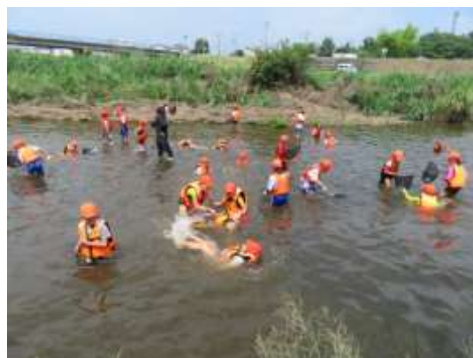
3年生の水辺観察会、百穴前(7月14日)