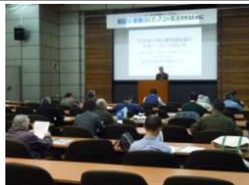
荒川流域再生シンポジウム(国立女性教育会館)