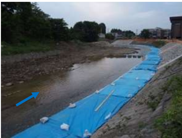
花菖蒲園周辺の工事現場（H27年5月）