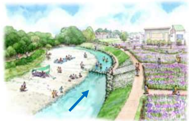
礫河原と飛び石など整備終了イメージ