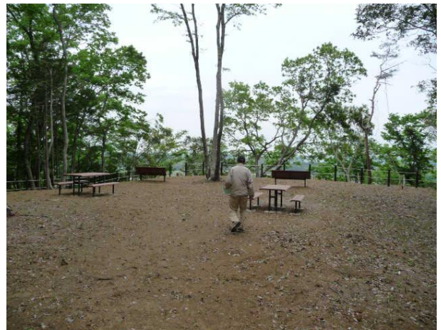
鞍掛山散策路と展望広場の工事現況（4月）