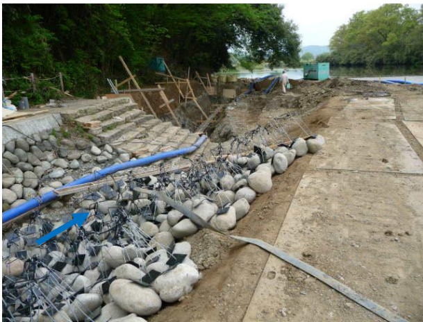
鞍掛堰右岸の工事現場（H29年4月）