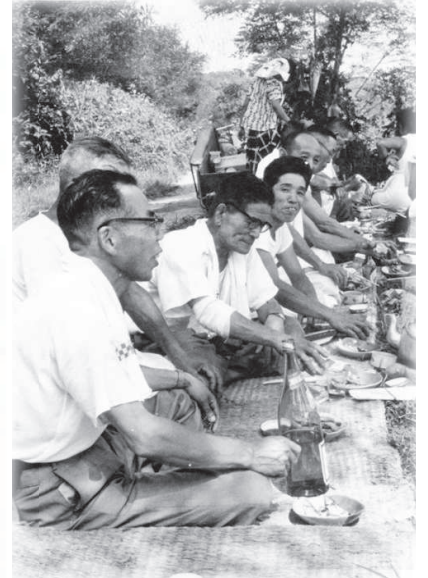
1959(昭和34)年7月30日に 都幾川、槻川の交流点、 二瀬付近で行われたアユ漁の様子