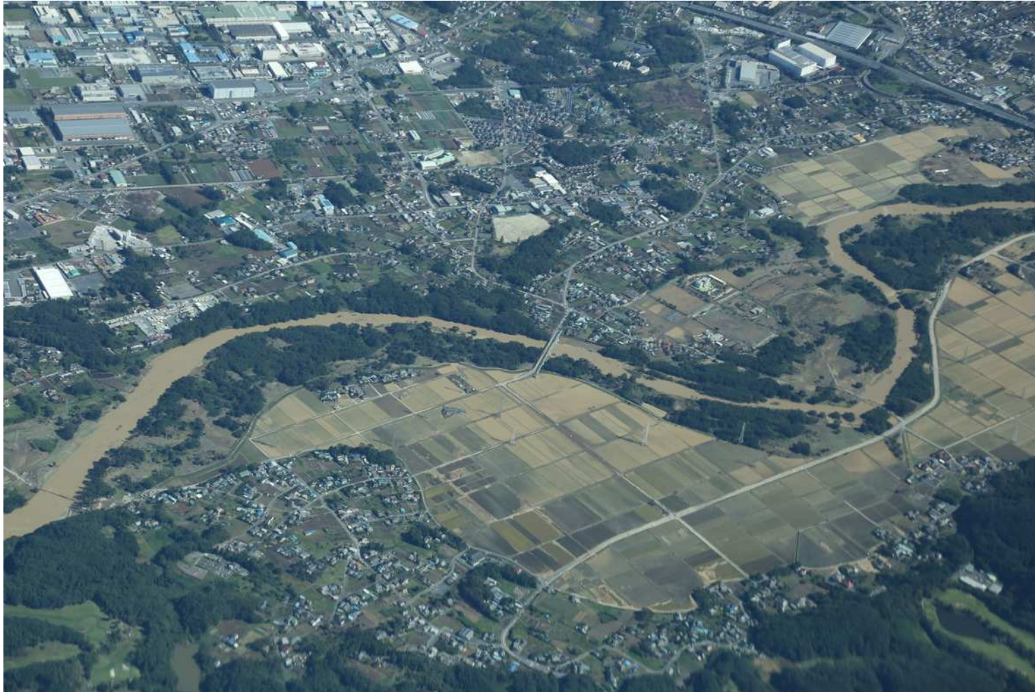
国土交通省 10月13日撮影 都幾川 神戸大橋 付近